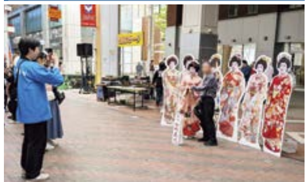
古町芸妓と写真撮影をする来場者の様子