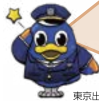
東京出入国在留管理局 マスコットキャラクター「とりぶ」