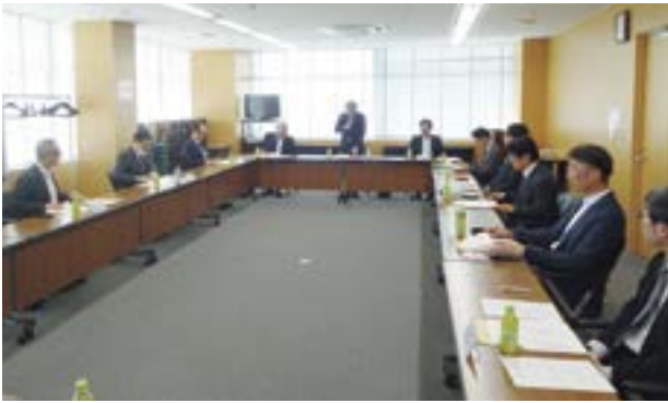
開会の挨拶をする木山委員長