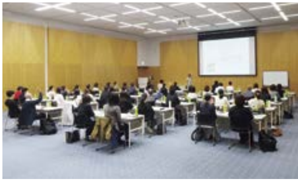
講師の質問に答える受講者