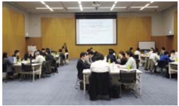
グループワークに取り組む様子