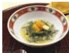
蓬豆腐と雲丹、ジュンサイを合わせた先付。季節を大切にした料理は、味はもちろん目でも楽しませてくれる。

また、鍋茶屋の歴史を語る上で欠かせないのが、古町花柳界とのつながりだ。お座敷に興を添える