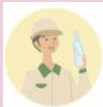
特定容器製造等事業者

ガラス・PETボトル・紙・プラスチック製の容器（特定容器）を作る、又は輸入しています。