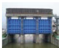
増水した本流からの逆流を遮断し、街を浸水被害から守るために設置された「樋門ゲート」。

こうして時代の変化に対応してきた同社は近年、SDGsの取組を推進。「取組を通して“自分たちは社会インフラや再生可能エネルギーに関わっている”という意義を社員が認識することに繋がって