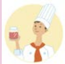
特定容器利用事業者

ガラス・PETボトル・紙・プラスチック製の容器（特定容器）を作る、又は輸入しています。