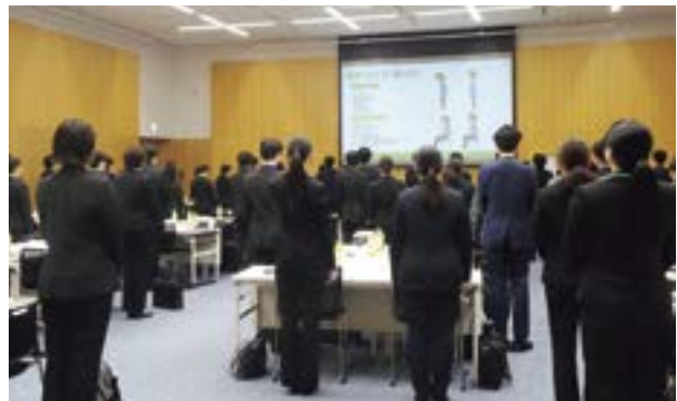
お辞儀の基本を実践する様子