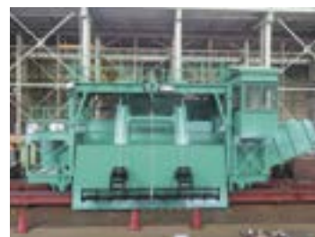
河川や水路のゴミを取り除く「除塵機」。レーキ（熊手）で水中の塵芥を掻き揚げ、設備の故障や詰まりを防ぐ役割を担っている。