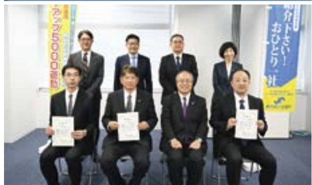
会員紹介件数上位の皆様と