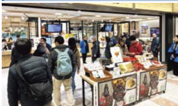
当日のイベントの様子（羽田空港内 羽田産直館）