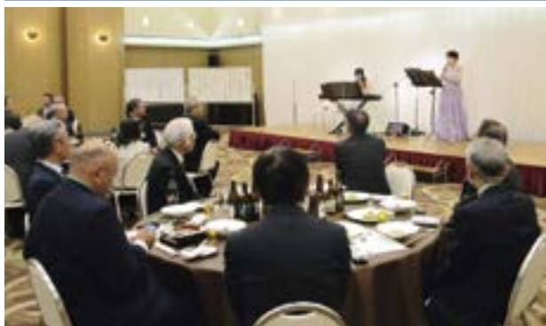
クラリネットとピアノの演奏