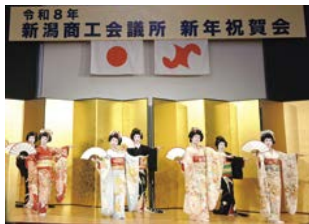
古町芸妓連による「正月踊り」