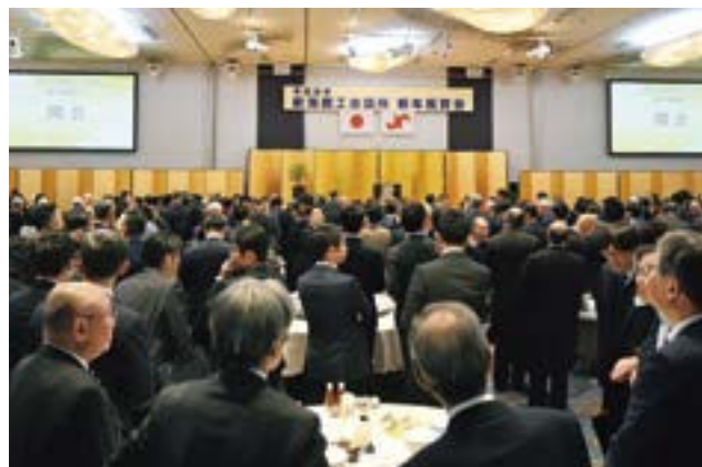
賑わう会場の様子