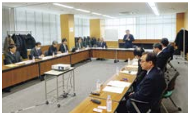
開会の挨拶をする木山委員長