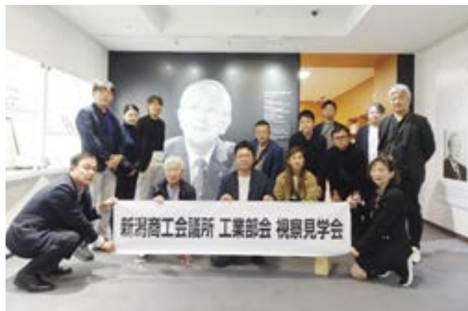
稲盛ライブラリー（京都市）にて (工業部会)