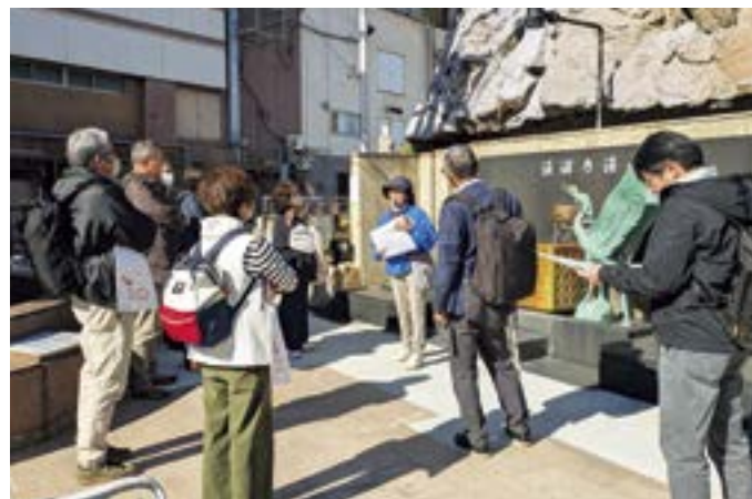
能登半島の和倉温泉見学の様子 (観光業部会)

本年も、皆様の事業の一助となるよう積極的な活動を展開していく所存ですので、どうぞよろしくお願い申し上げます。