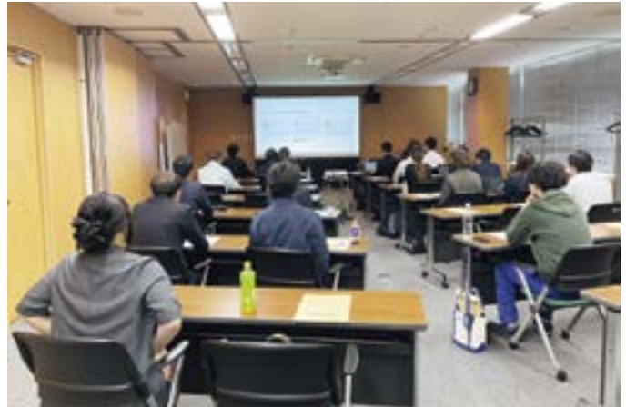
実践DXセミナーの様子