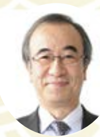
新潟県知事 花角 英世