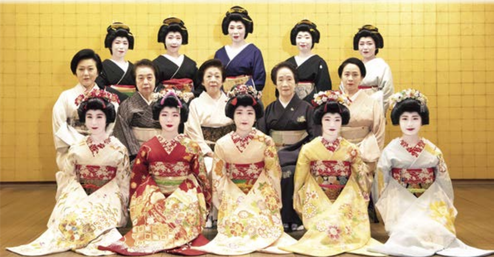
みなとまち新潟が誇る伝統文化「新潟古町芸妓」の皆様