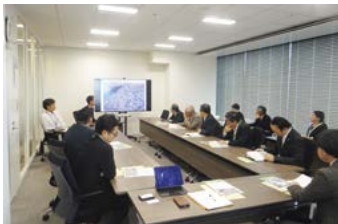
JR大阪駅北側うめきたプロジェクトの説明を聞く一行 (建設・不動産部会)