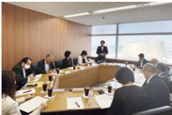
パワーアップ5000推進委員会の様子