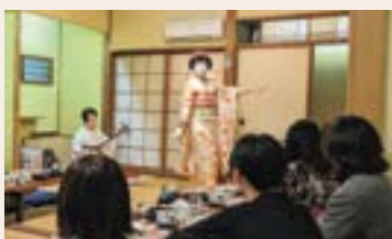
昨年開催時の様子