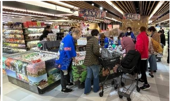
【徳島県(令和 5 年)】