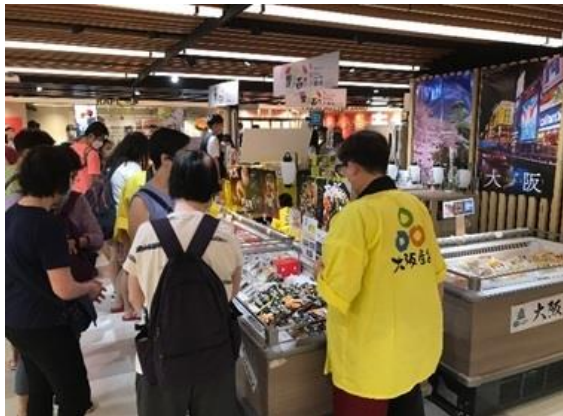
【大阪府(令和 3 年)】