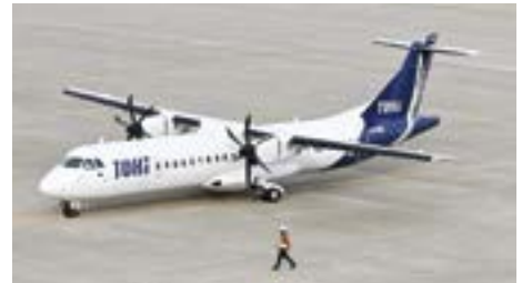
▲出発前の機体（新潟空港）