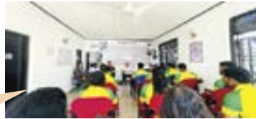
＜スリランカに設置した学校の様子＞

昨年から日本企業に就職を希望する人の教育機関として、スリランカ人に日本の言葉や生活マナーを教える学校を作り、現在は30人ほどが学んでおります！