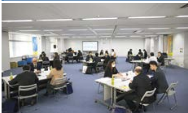
グループ別に情報交換を行う様子