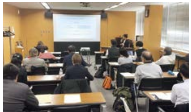
熱心に耳を傾ける経営者たち