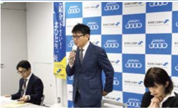
開会の挨拶をする若山委員長