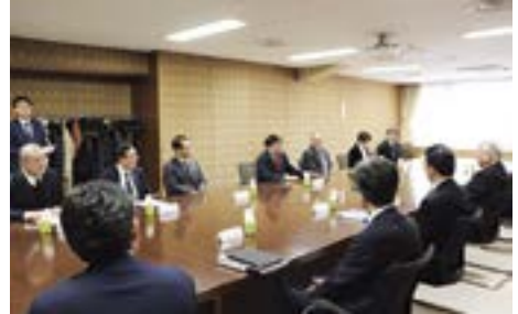
札幌商工会議所への表敬訪問の様子

丘珠空港はJR札幌駅の北西約6キロに位置し、札幌市の中心部とは地下鉄でも結ばれています。同空港からは函館、釧路、女満別、利尻島などへの乗り継ぎが可能で、北海道内における旅行地の選択肢が広がります。