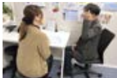
カウンセリングルーム