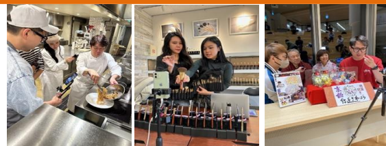
「ライブ配信当日の様子」