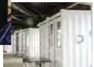
コンテナ商業施設「フルサット」