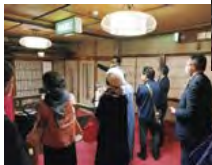
百年料亭 「宇喜世」施設見学の様子

「岩の原葡萄園」では歴史とワイン造りへのこだわりを紹介していただきながら施設見学を行い、試飲を楽しみました。