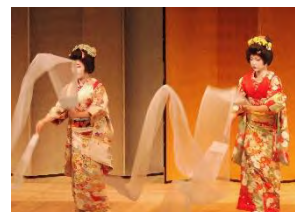
舞を披露する古町芸妓

【お問合せ】 新潟商工会議所 まちづくり支援課 TEL : 025-223-6272