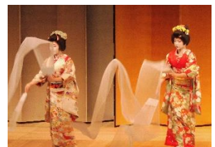
舞を披露する古町芸妓

【お問合せ】 新潟商工会議所 まちづくり支援課 TEL : 025-223-6272