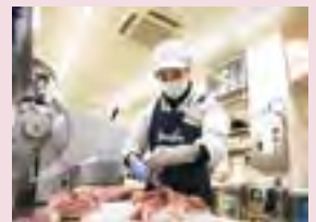
活躍する外国籍社員

外国籍の従業員がこれまでの経験を活かし、日本人とは違った視点や思考から新たなサービスを提供できるように取り組んでいる。外国籍社員のうち1名は商品の開発業務に携わっており、2020年度には外国籍社員をさらに59名採用している。