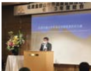
決議を提案する福田県連会頭