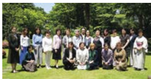
新緑の五十嵐邸ガーデン