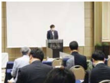
部会長のあいさつ