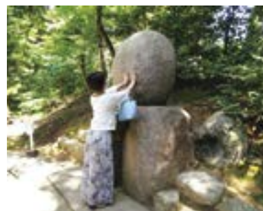
巨飯野神社の神様が宿るとされる「御神霊石」

女性会では会員相互の研鑽や交流を図るため、研修会等を開催し、元気で夢の持てる地域社会づくりに貢献することを目的に活動しています。女性経営者・女性役員等の皆様のご加入をお待ちしております。(現在会員数100名) (お問合せは会員サービス課まで) TEL 025-290-4209(直通)