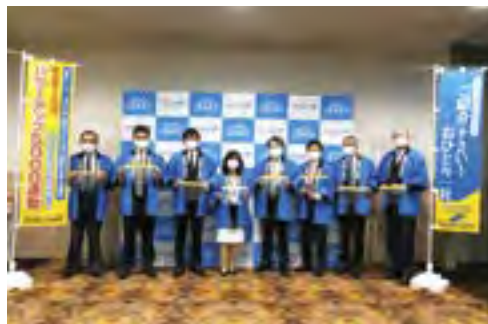
感染防止対策を講じて会員増強を呼びかける パワーアップ5000推進委員会

結びに、本日ご出席の皆様のご健勝と各事業所の更なるご繁栄をお祈り申し上げ、年頭のご挨拶とさせていただきます。本年もどうぞよろしくお願い申し上げます。