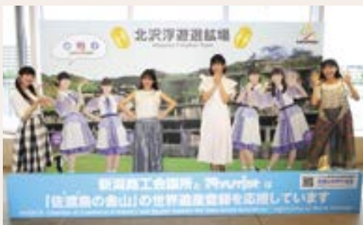
デザインを刷新したエスプラナード設置の応援パネル (実際のRYUTistと撮影)

新しいデザインは、地元アイドルのRYUTistを引き続き起用しました。パネルと一緒に写真を撮り、SNS等にアップして、世界遺産登録活動を一緒に盛り上げていただければ幸いです。