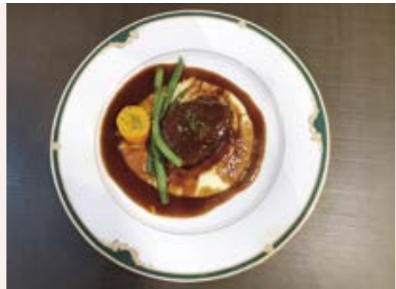
本日のディナーコースのメイン肉料理、牛ネックの赤ワイン煮込み。Aコース(4,000円)は、前菜またはスープ、メインの肉料理が魚料理、パン、デザート、コーヒー付き。Bコース(5,000円)は、前菜またはスープ、肉料理と魚料理、パン、デザート、コーヒー付き

この店のこだわりはガルニチュール(つけ合わせ)にも。地元の自家製農園で栽培したニンジン、インゲンマメ、ジャガイモ、ブロッコリー、ダイコンなどの新鮮な旬の野菜類がさまざまな料理に生かされています。それらを含むディナーのコースは豊富で、Aコース(4,000円)、Bコース(5,000円)、黒毛和牛のおまかせコース(7,500円)などがあります。週4日間はランチもあり、Aランチ(3,500円)、スープのランチ(2,500円)などが喜ばれています。