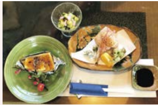
タケノコのみそ田楽(680円)、エビしんじょう揚げとフキとウドの天ぷら(630円)、タケノコの木の芽あえ(500円)は、今日のおすすめ料理の中の3品

替わり定食(770円)。この日はカレーの西京漬け、茶わん蒸し、ゼンマイの煮物、漬物、みそ汁、ご飯。毎日メインの魚が替わるので常連客にはうれしいメニューです。