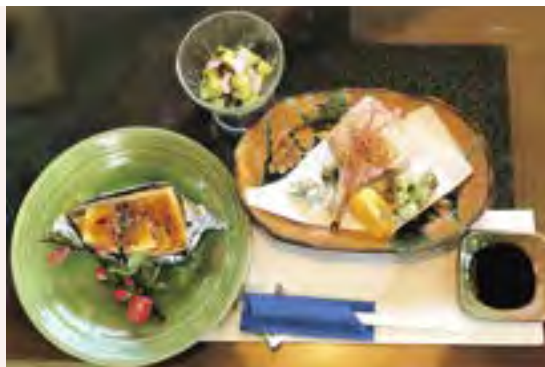
タケノコのみそ田楽(680円)、エビしんじょう揚げとフキとウドの天ぷら(630円)、タケノコの木の芽あえ(500円)は、今日のおすすめ料理の中の3品

替わり定食(770円)。この日はカレーの西京漬け、茶わん蒸し、ゼンマイの煮物、漬物、みそ汁、ご飯。毎日メインの魚が替わるので常連客にはうれしいメニューです。