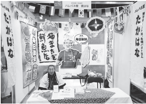
当所支援ブース (貴はな様)

当所は会員企業20社に対し、出展費用の支援を行い、参加企業は、販路開拓に向けた自社製品のPRや、新規顧