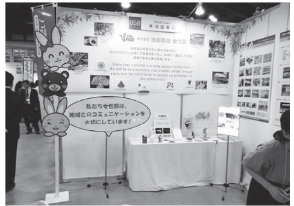
当所支援ブース (株池田看板様)