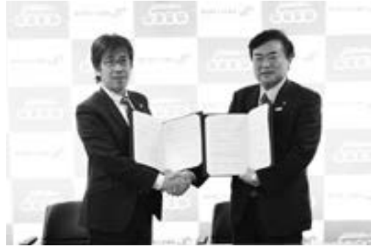
連携協定を結んだ福田会頭(右)と菊池県弁護士会長(左)

今後は、相互の情報交換やセミナー講師の派遣などを通じ、中小企業への情報提供や人材育成、事業承継支援などを協力して行う予定です。