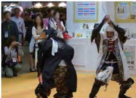
来場者の注目を集めた武将隊パフォーマンス

日本商工会議所は、9月23～25日まで、東京ビッグサイトで開催された「ツーリズムEXPOジャパン2016」に、全国の商工会議所の観光商品を紹介する共同展示ブースを出展した。参加した商工会議所は、登別（北海道）、久慈（岩手県）、酒田、新庄（山形県）、上越、糸魚川、加茂（新潟県）、上田、下諏訪、塩尻（長野県）、静岡（静岡県）、柳川（福岡県）、八代（熊本県）の13商工会議所。