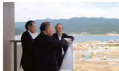
大船渡市内を視察する三村会頭