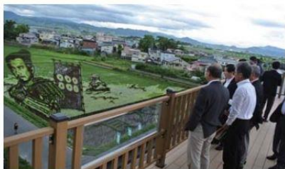
7色の稲を使った「田んぼアート」