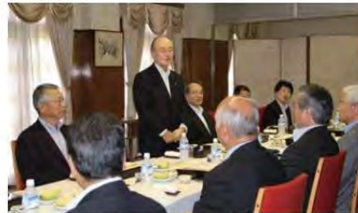
釜石商工会議所幹部と懇談する三村会頭

日本商工会議所の三村明夫会頭は7月8日、岩手県釜石市と大船渡市を訪問。釜石商工会議所ならびに大船渡商工会議所との懇談会を開催するとともに、市街地の復興状況などを視察した。