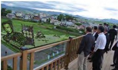
7色の稲を使った「田んぼアート」