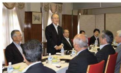
釜石商工会議所幹部と懇談する三村会頭

日本商工会議所の三村明夫会頭は7月8日、岩手県釜石市と大船渡市を訪問。釜石商工会議所ならびに大船渡商工会議所との懇談会を開催するとともに、市街地の復興状況などを視察した。