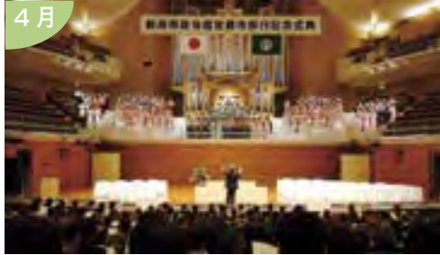
2007年4月1日、永年の取り組みが実り 本州日本海側初の政令指定都市・新潟が誕生 新潟市政令指定都市移行記念式典を開催