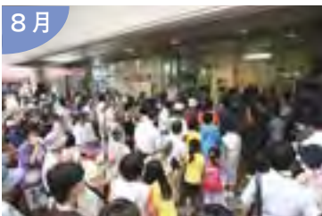
旧大和新潟店にて賑わい創出に 向けた「ふれ愛古町」をスタート！ ～古町地区まちなか活性化事業～