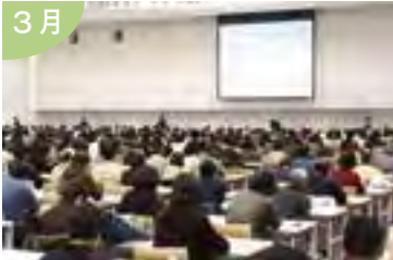
新潟の良さを再発見！ 「第1回新潟市観光・文化検定」 (ニイガタ検定)に約2,700人が受験