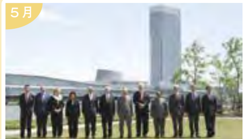
新潟の朱鷺メッセを主会場に開催し 「新潟宣言」が採択されたG8労働大臣会合