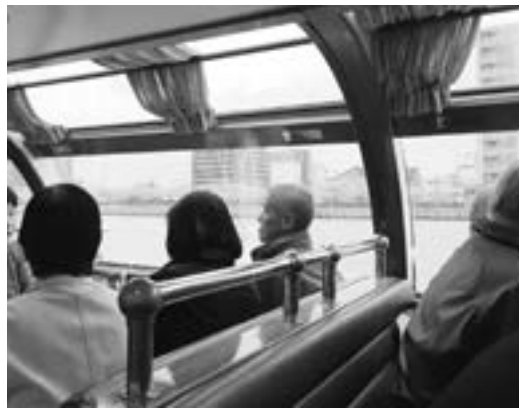
船内からの桜のようす

信濃川ウォーターシャトルを利用した会員限定の『お花見クルーズ』を、4月13日に実施しました。