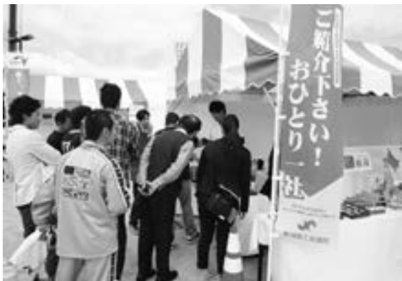
多くの利用で賑わう当所ブース