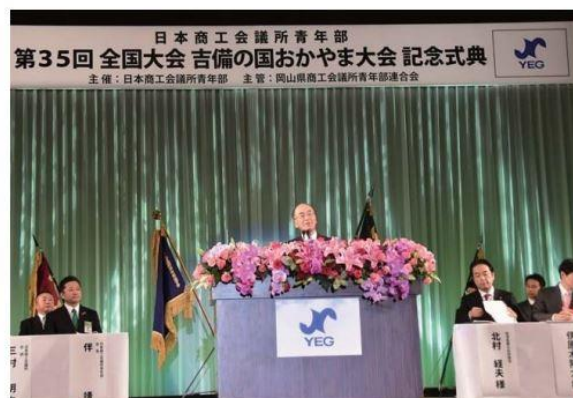
あいさつする三村会頭

を担う青年部の活動に大いに期待している。若さ、情熱、広い視野こそ今の日本に必要な」とエールを送った。