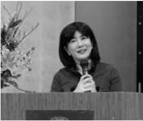
講演する中野信子氏

中野氏の講演概要は次のとおり。①脳には前頭前皮質という「義（良心）」の領域があり、教育環境によって発達の違いが変わる②新潟県民は、厳しい自然環境の中で助け合いながら生きて来たため、前頭前皮質が発達しやすい環境であると考えられる③願いを実現させるためには、自分の不安要素を把握したうえで、将来、私は願いを実現した状態であるという意識することが重要である。参加者からは多数の質問が飛び交うなど、熱心に聴講していました。