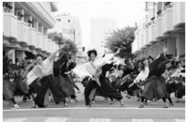
会長賞受賞団体（下駄っばーず）による演舞

実行委員会会長賞には「下駄っばーず（東京都）」、新潟市長賞には「舞桃会（新潟市北区）」、新潟県知事賞には「和童（新