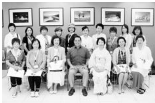
グアム政府観光局にて

次に訪れたグアム商工会議所では、グアムの女性経営者との懇談会を行い、お互いの事業をアピールしながら、積極的に交流を図りました。 近年、グアムにおいても起業する女性が増えてきているとのことであり、「女性のリーダーとして若手を育てることが目下の課題である」といった共通の問題点