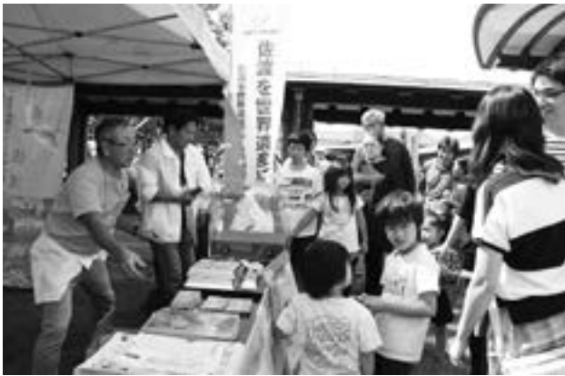
好評だった金塊掴み取りゲームのブース