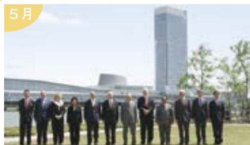
新潟の朱鷺メッセを主会場に開催し 「新潟宣言」が採択されたG8労働大臣会合