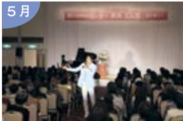
～女性会10周年記念事業～ 新潟出身シャンソン歌手 渋谷文太郎氏のコンサートを開催