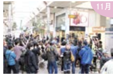
映像を通じてまちづくりを目指す 新潟ロケネットが10周年を迎え 記念の大感謝祭を開催