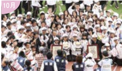
45年ぶりに新潟での開催となった 「トキめき新潟国体」 11日間熱戦が繰り広げられた