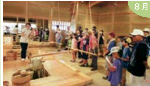
佐渡金銀山の世界遺産登録への関心を高める ため、佐渡金銀山親子見学ツアーを開催