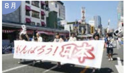
東日本大震災からの復興に向け 新潟から元気を発信！ ～平成23年新潟まつり～