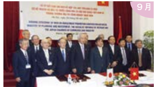
海外展開における環境整備・改善を図ることを 目的とした日商のベトナム・ミャンマー経済 ミッションに敦井会頭が副団長として参加