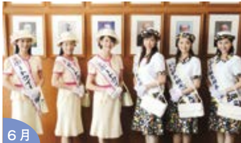
にいがたの市民外交のシンボルとして 「ポートクイーン新潟」から名称を変え、 「にいがた観光親善大使」が新たに誕生