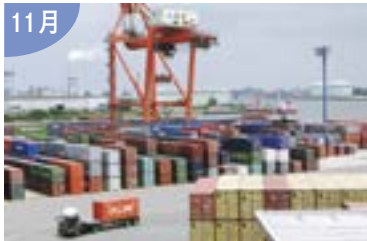
太平洋側被災港湾の機能を代替！ 新潟港が日本海側拠点港湾に選定