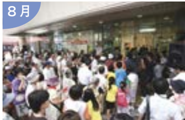
旧大和新潟店にて賑わい創出に 向けた「ふれ愛古町」をスタート！ ～古町地区まちなか活性化事業～