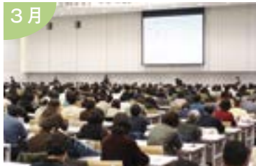
新潟の良さを再発見！ 「第1回新潟市観光・文化検定」 (ニイガタ検定)に約2,700人が受験