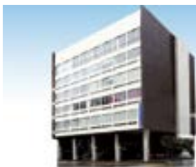
新潟経済を見守り続けた、当所 中央会館が2013年3月末で閉館 半世紀の歴史に幕を降ろす