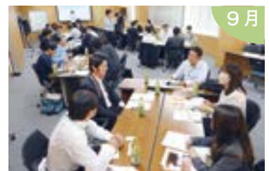
会員のビジネスチャンス 拡大につなげるため、第1回 「ビジネス情報交換会」を開催