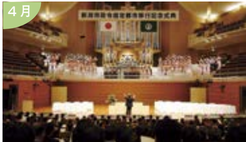
2007年4月1日、永年の取り組みが実り 本州日本海側初の政令指定都市・新潟が誕生 新潟市政令指定都市移行記念式典を開催