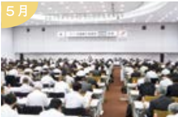
「第67回全国商工会議所専務理事・ 事務局長会議」を新潟で開催 全国から約400名が集結