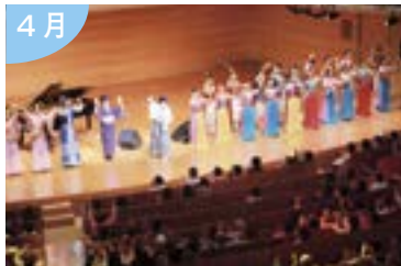
東アジア文化都市選定でさらに パワーアップ！ ～アート・ミックス・ジャパン2015～